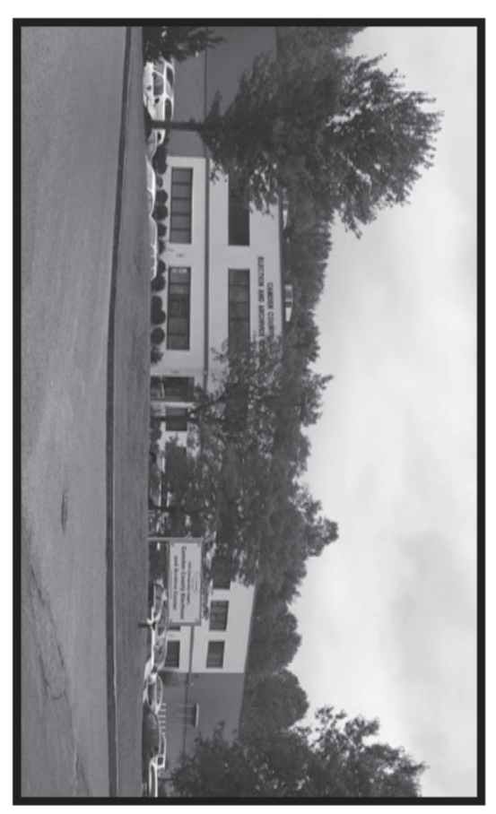
Camden County Elections and Archive Center Centro de Elecciones y Archivos del Condado de Camden

If you are not able to vote at the Polls or the Early Voting Center, there is still time to receive a Vote by Mail Ballot. The application must be received by the County Clerk's Office by May 28th. For an application and more information about Vote by Mail, please call (856) 225-7219 or visit www.camdencounty.com/vbm .