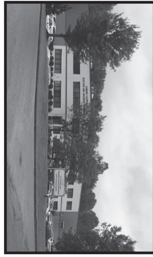
Camden County Elections and Archive Center Centro de Elecciones y Archivos del Condado de Camden

If you are not able to vote at the Polls or the Early Voting Center, there is still time to receive a Vote by Mail Ballot. The application must be received by the County Clerk's Office by May 28th. For an application and more information about Vote by Mail, please call (856) 225-7219 or visit www.camdencounty.com/vbm .