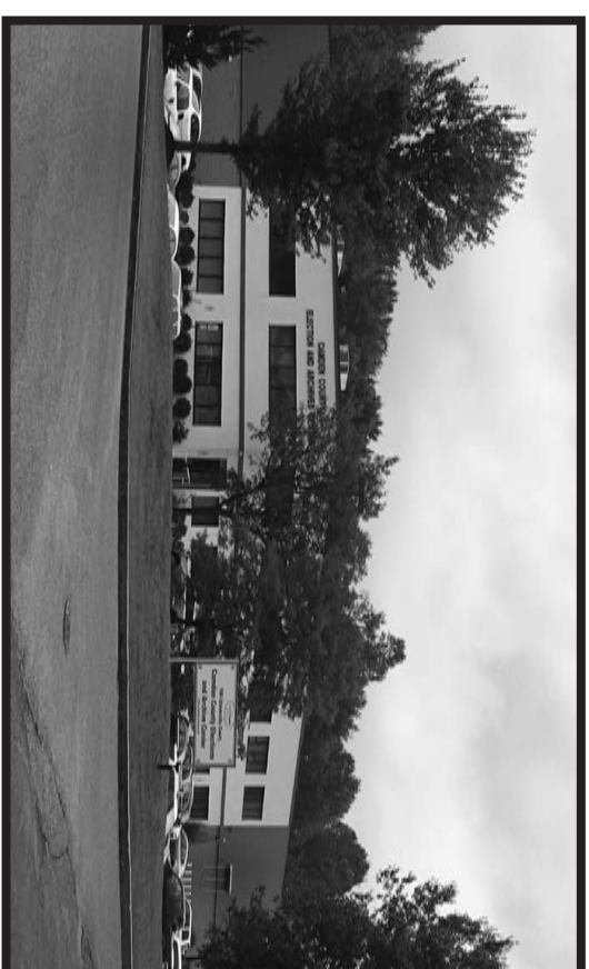
Camden County Elections and Archive Center Centro de Elecciones y Archivos del Condado de Camden