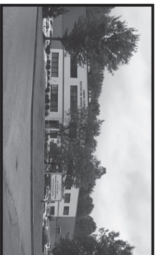
Camden County Elections and Archive Center Centro de Elecciones y Archivos del Condado de Camden

If you are not able to vote at the Polls or the Early Voting Center, there is still time to receive a Vote by Mail Ballot. The application must be received by the County Clerk's Office by October 30th. For an application and more information about Vote by Mail, please call (856) 225-7219 or visit www.camdencounty.com/vbm .