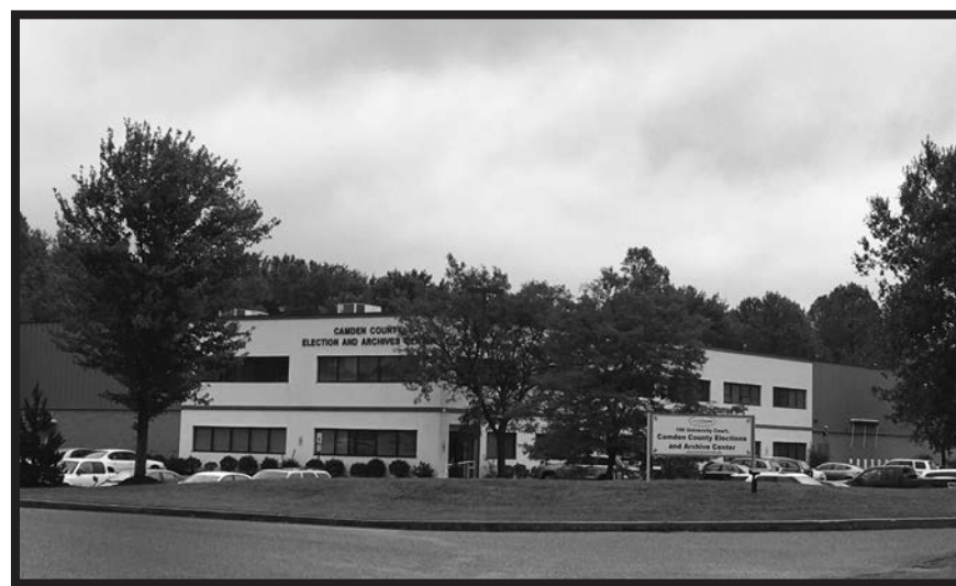
Camden County Elections and Archive Center Centro de Elecciones y Archivos del Condado de Camden

GPS: 39°46'33.6"N 75°02'52.8"W 39.776000, -75.048000